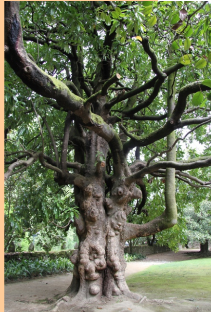
Magnolia ( Magnolia grandiflora ) -3,88 m de perímetro.