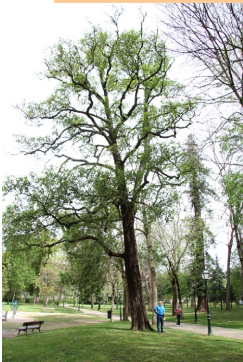
Amieira, ameneiro ( Alnus glutinosa ) -2,75 m de perímetro.