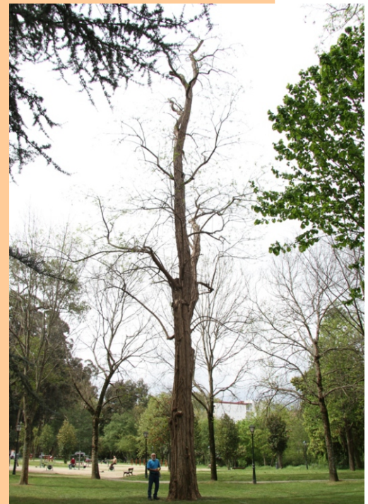
Robinia ( Robinia pseudoacacia ) -3,05 m de perímetro.