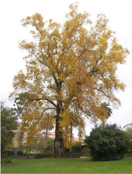
Tulipeiro de Virxinia ( Liriodendron tulipifera ) -40 m de altura, 6,61 m de perímetro. Incluído no catálogo de árbores senlleiras da Xunta de Galiza.