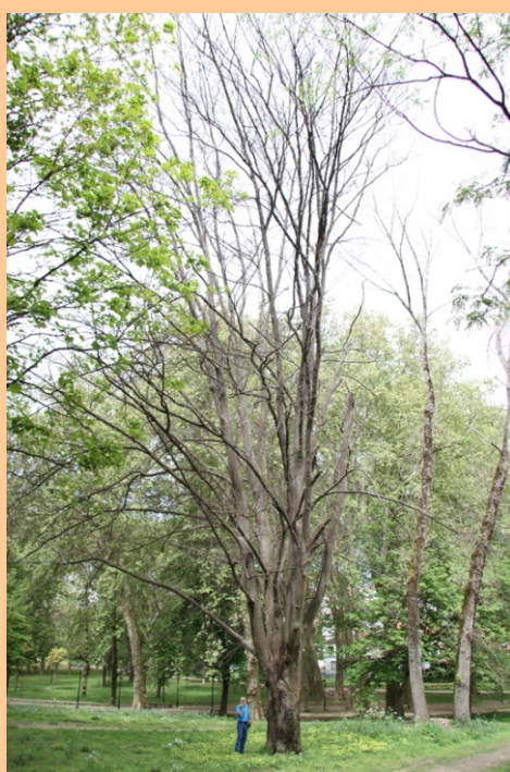
Faia púrpura Fagus sylvatica "Atropurpurea" Varios exemplares, a máis grande mide 38 m de altura e 3,19 m de perímetro.