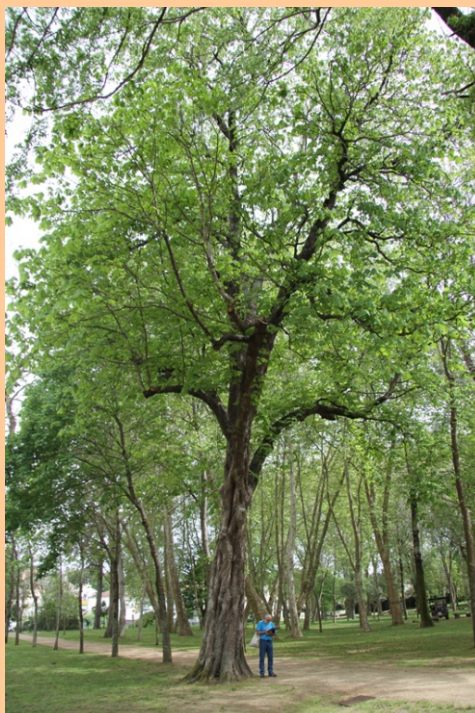
Castiñeiro de Indias ( Aesculus hippocastanum ) -3,49 m de perímetro