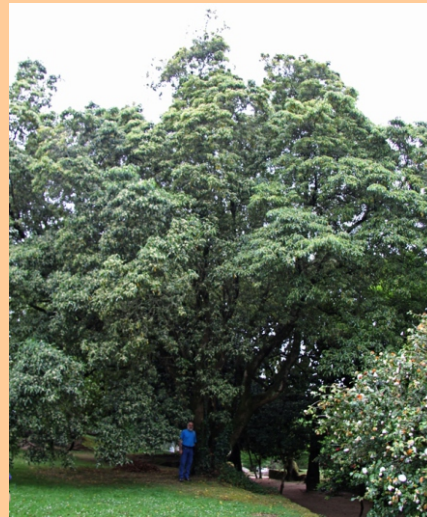
Pitosporo ( Pittosporum undulatum ) -15 m de altura, 2,65 m de perímetro.