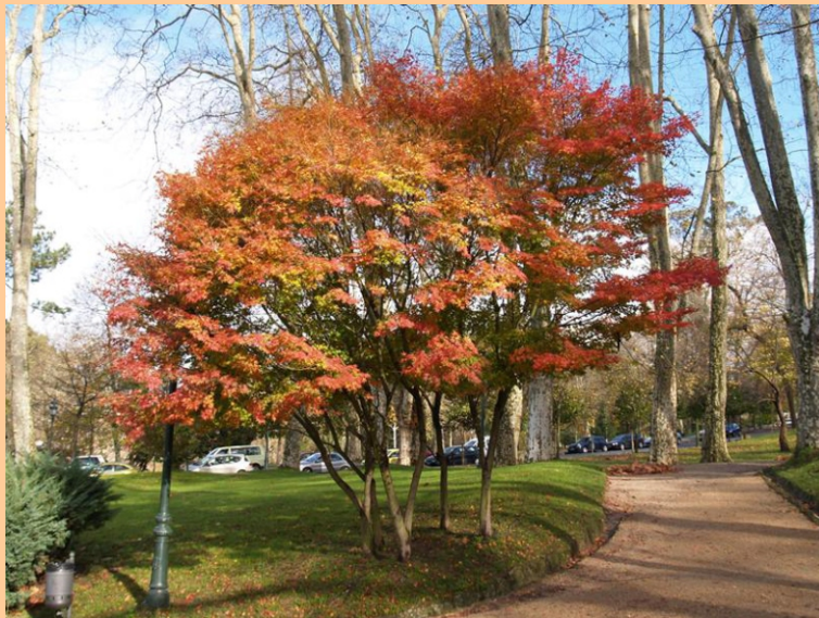
Arce xaponés ( Acer palmatum )