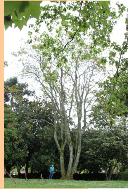
Ailanto ( Ailanthus altissima ) -22 m de altura