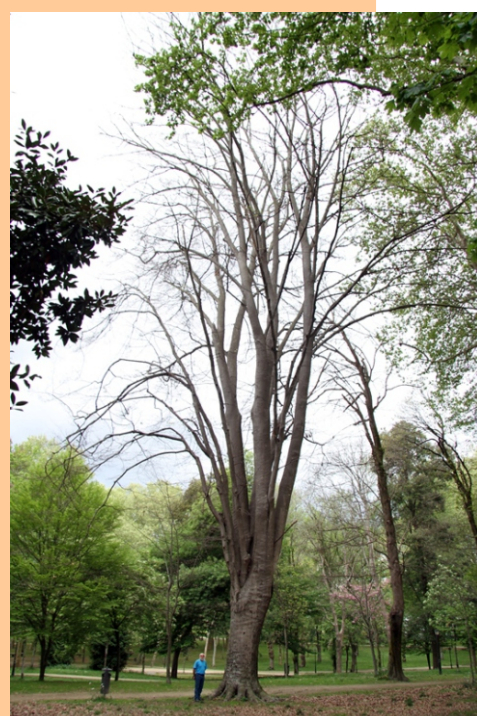
Faia ( Fagus sylvatica ) -45,6 m de altura; 3,84 m de perímetro. Incluída no catálogo de árbores senlleiras da Xunta de Galiza.