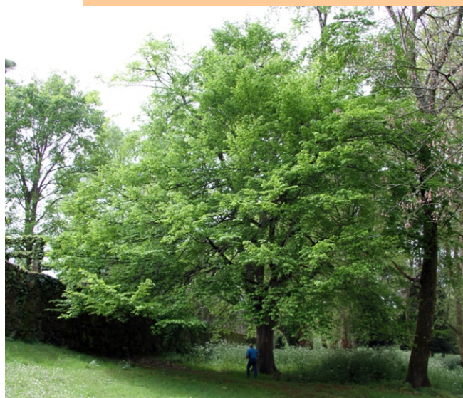
Carpe ( Carpinus betulus ) Cinco exemplares. O máis grande mide 23 m de altura e 3,15 m de perímetro.