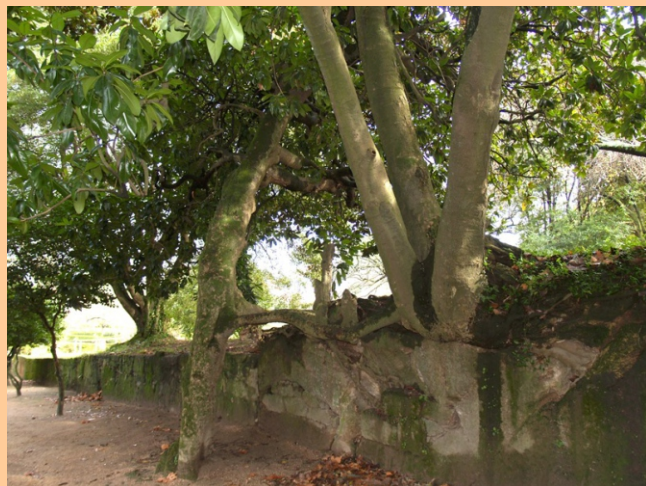
Magnolia Magnolia grandiflora -11 m de altura, 1,44 m de perímetro.