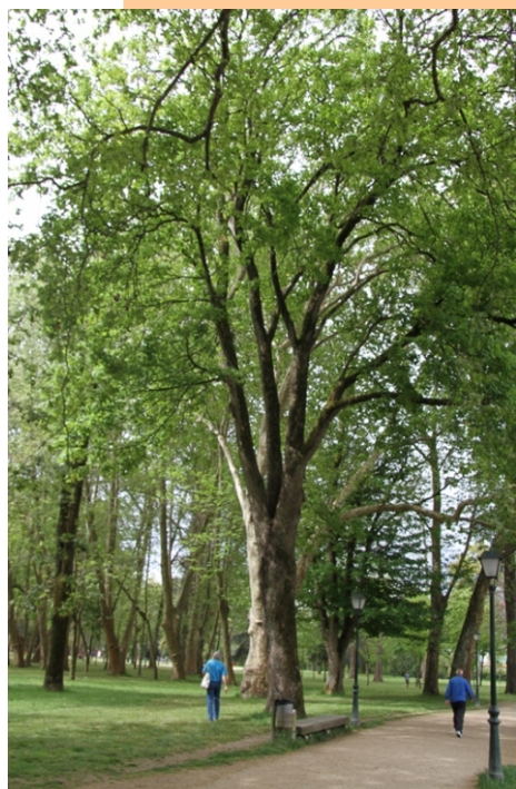
Pradairo ( Acer pseudoplatanus ) -34 m de altura e 2,72 m de