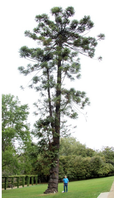
Araucaria do Brasil (Piñeiro do Paraná) Araucaria angustifolia -2,98 m de perímetro.