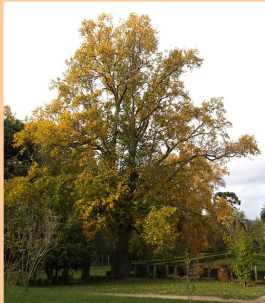
Tulipeiro de Virxinia ( Liriodendron tulipifera ) -32,9 m de altura, 6,38 m de perímetro. Incluído no catálogo de árbores senlleiras da Xunta de Galiza.