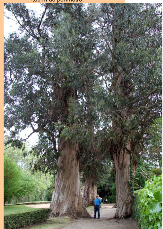
Eucaliptos ( Eucalyptus globulus ) -54 a 59 m de altura e ata 6,30 m de perímetro. Incluídos no catálogo de árbores senlleiras da Xunta de Galiza