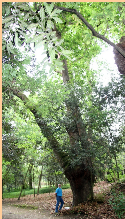
Carballo ( Quercus robur ) -4,54 m de perímetro.