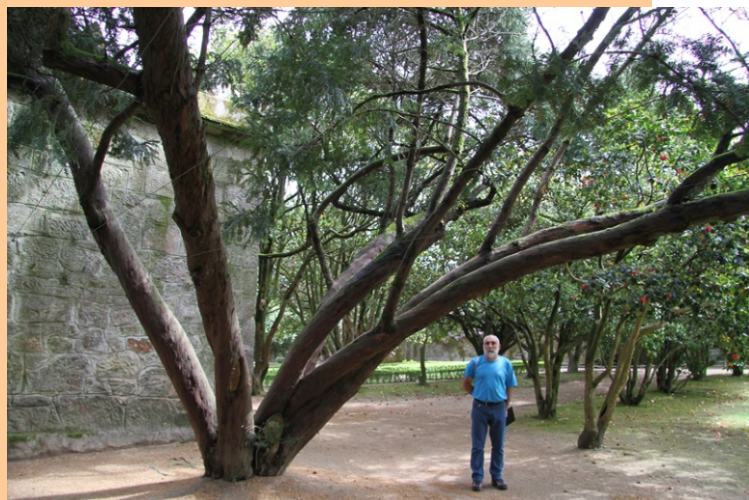
Cefaloteixo ( Cephalotaxus fortunei )