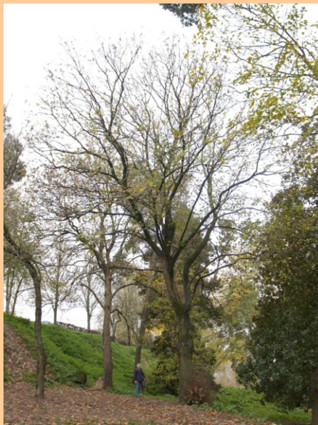
Arce real ( Acer platanoides ) -34 m de altura, 2,45 m de perímetro.