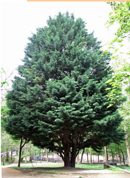
Alcipreste de Leyland ( Cupressocyparis leylandii )