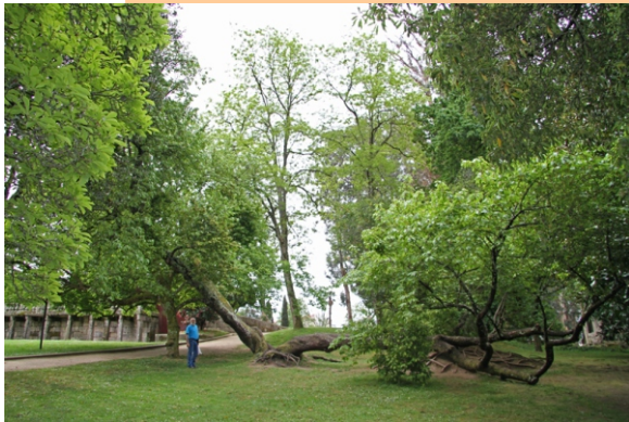
Cerdeira, cereixeira ( Prunus avium )