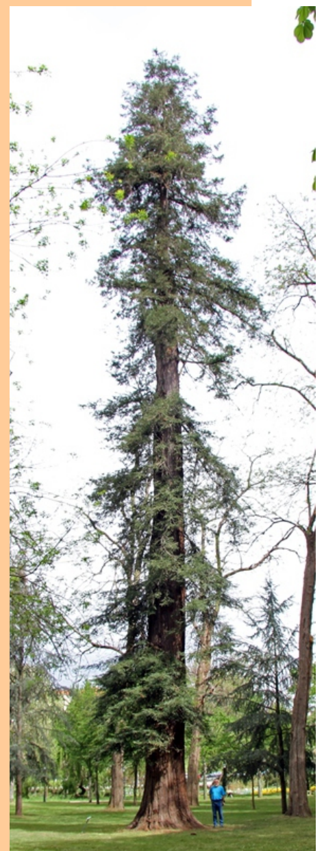
Secuoia vermella ( Sequoia sempervirens ) -4,79 m de perímetro.