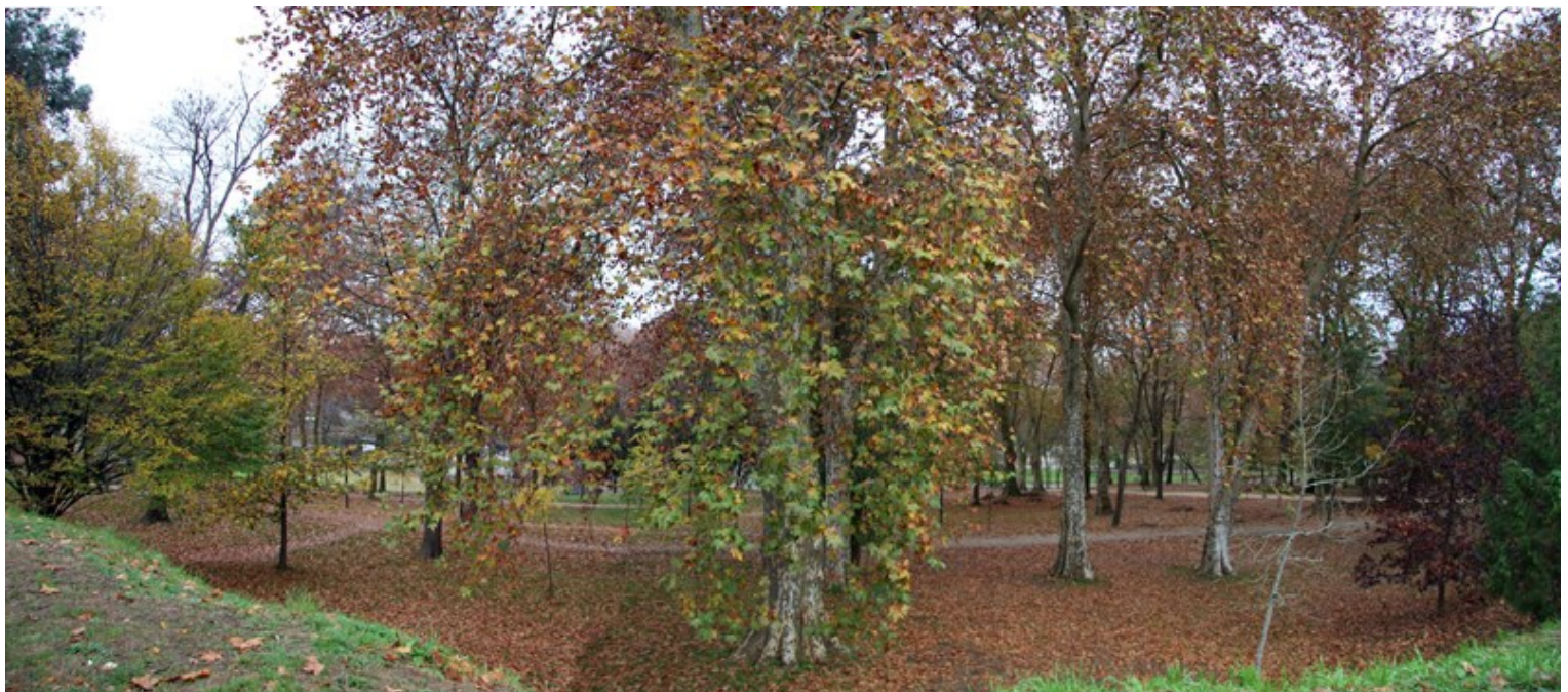
Panorámica do parque de Castrelos no outono

Este espazo está declarado Ben de Interese Cultural (BIC) e Xardín Histórico desde 1955. Conta cun aparcadoiro, un auditorio ao aire libre, xogos infantís, paneis informativos, e rótulos botánicos. Ademais algunhas árbores están incluídas no Catálogo de árbores senlleiras de Galiza: Musalén das camelias, carreira de eucaliptos, faias e tulipeiros de Virxinia.