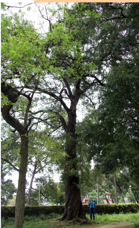
Acacia ( Acacia melanoxylon ) -4,33 m de perímetro